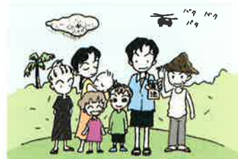
『わたしの憲法手帳』イラスト・大城ゆか (発行:沖縄県憲法普及協議会)より